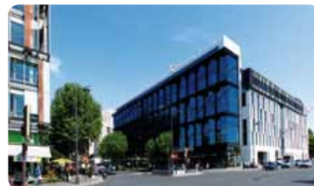
Le pôle tertiaire de la porte des Lilas, Paris 20 e