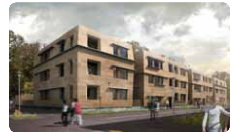
Logements à Nancy - Jourda Architectes Paris © JAP; Image: Jérôme Reynault

Durable / HQE / Contenant / Contenu / Échelles / Volumes / Lumière / Liaisons / Formes / Effets de matière / Processus constructif / Détails / Couleurs