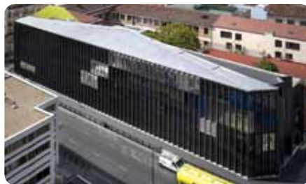
Conservatoire Léo Delibes, Clichy-la-Garenne, Bernard Desmoulin

Que demander à un architecte ? / Que sait-il faire ? / À quoi sert-il ? / Quelle langue parle t'il ? / De quoi est-il responsable ?