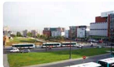
La nouvelle porte des Lilas, Paris 19 e

Un parc de 14 ha, un cinéma, un cirque, une bibliothèque, l'amélioration de la desserte et la création d'un pôle tertiaire et commercial de 50 000 m 2 , contribuent à transformer ce lieu en une nouvelle centralité vivante et attractive.