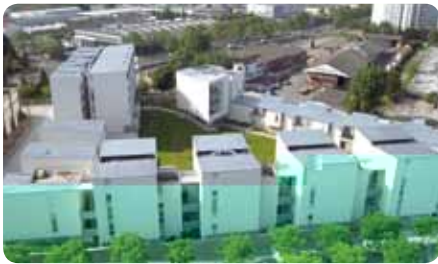
82 logements plus, Cité des 4000, La Courneuve, Emmanuelle Colboc

Temps / Qualitatif / Quantitatif / Choisir l'architecte / Écouter l'architecte Équipe / Partage / Enrichir le projet