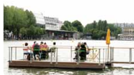
Le bassin de la Villette, Paris 19 e