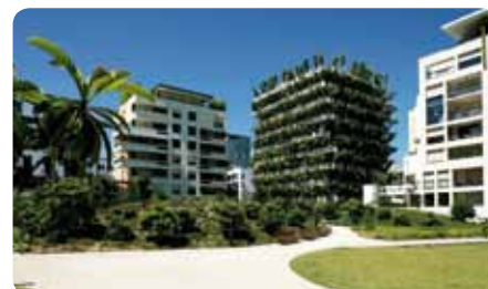
Les hauts de Malesherbes, Paris 17 e