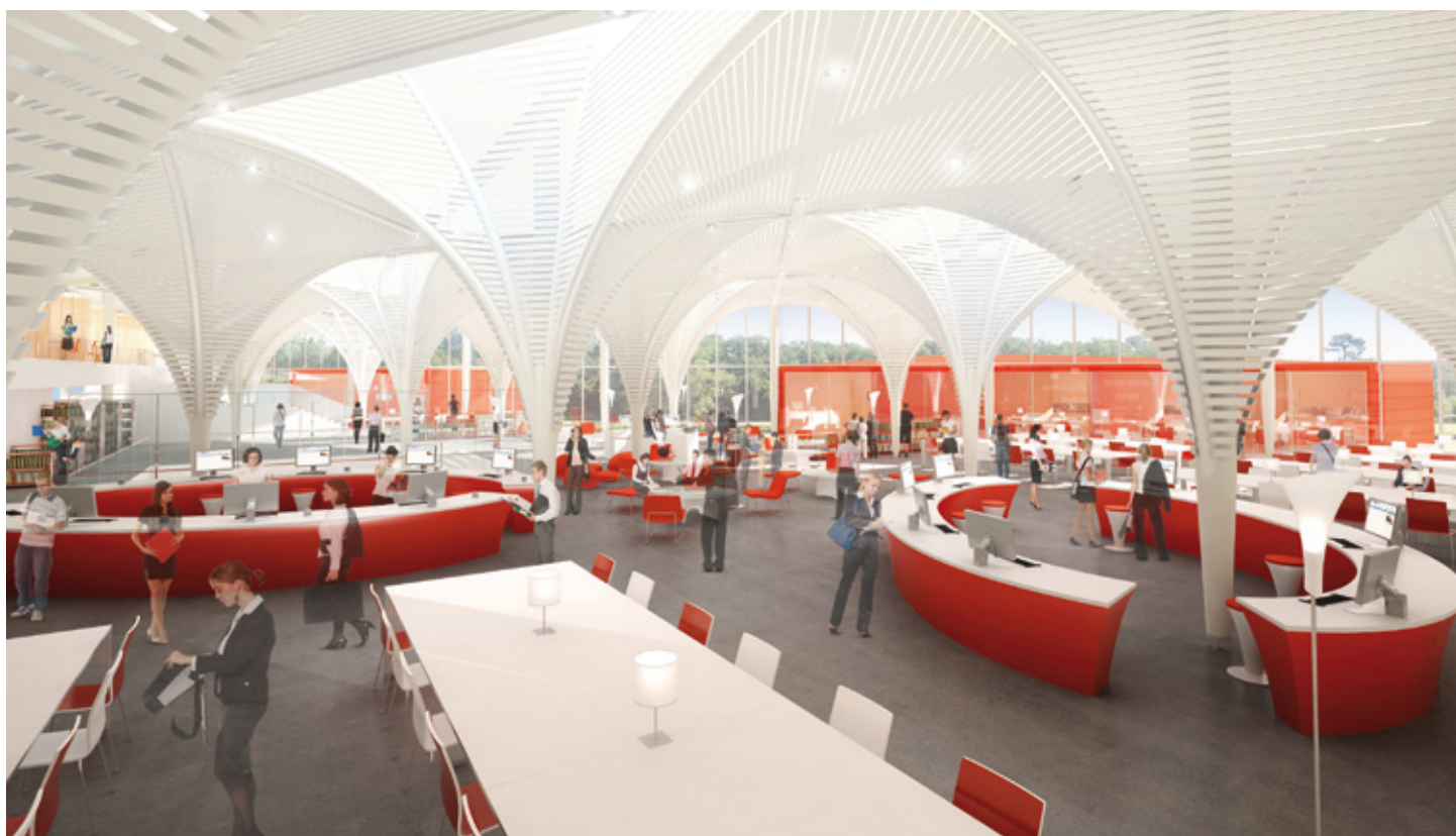
Perspective sur l'intérieur de la bibliothèque

L'agence d'architectes CHABANNE & PARTENAIRES (Paris, Lyon, Montpellier) est spécialisée dans la conception d'ouvrages publics et collectifs complexes dans le domaine de la santé, de l'enseignement, du sport & des loisirs. Elle a réalisé plus de 300 équipements en France dans ces domaines (hôpitaux, collèges, stades, bibliothèques, etc). L'agence compte aujourd'hui 150 collaborateurs dont 50 architectes.