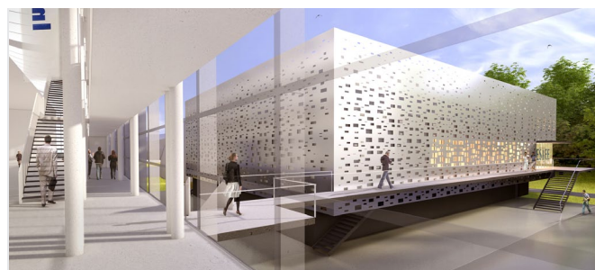
Les Salles Blanches de microélectronique de l'ESIEE de Noisy-le-Grand © Chabanne + Partenaires