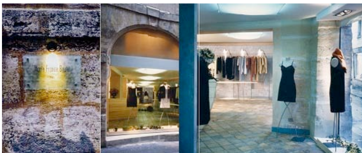
Réaménagement et décoration d'un magasin de prêt-à-porter Lionel Loris, Maître d'œuvre eOspace, Paris

eOspace accompagne les maîtres d'ouvrages (particuliers, entreprises, associations, collectivités) dans leur projet de construction ou de rénovation (logements, bureaux, ERP ...), avec des solutions environnementales créatives, innovantes et abordables : de la conception architecturale et technique jusqu'à la réception des travaux.