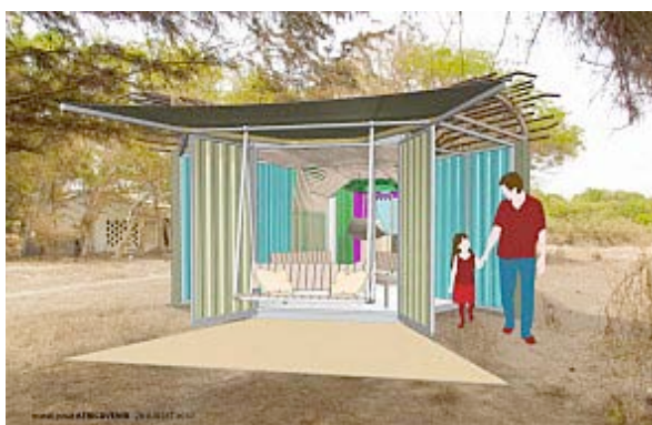
Projet Hotaï, Matali Crasset