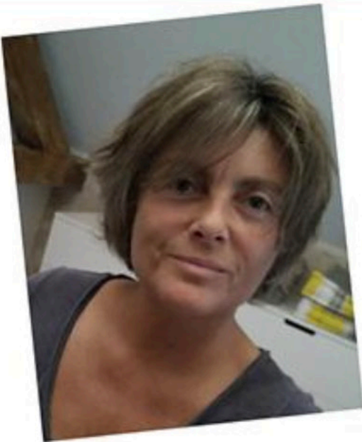
Home office "covid19"