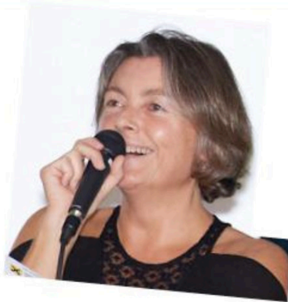
Sur événement octobre 2019